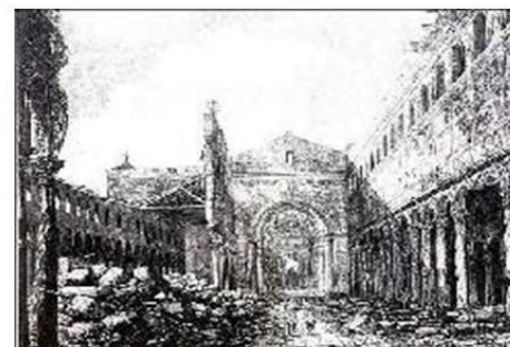
La Basilica di San Paolo fuori le Mura dopo l'incendio del 1823