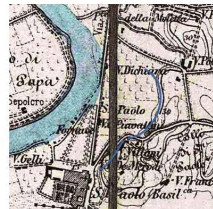
L'ansa del Tevere e la rupe di S. Paolo