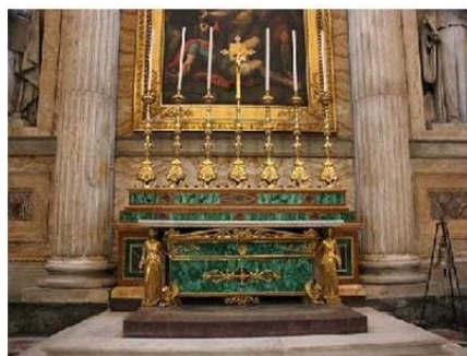
Altare in malachite di Russia

MARIPOSA per i celiaci onlus vi invita al tour geologico guidato da