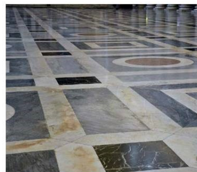
pavimento in pietra ornamento

Marco Pantaloni Servizio Geologico d'Italia ISPRA